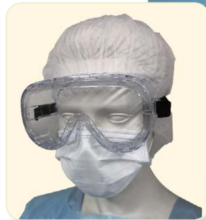
頭部保護装備拡大写真